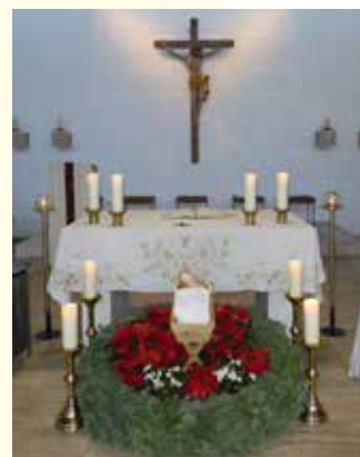
St. Franziska Romana