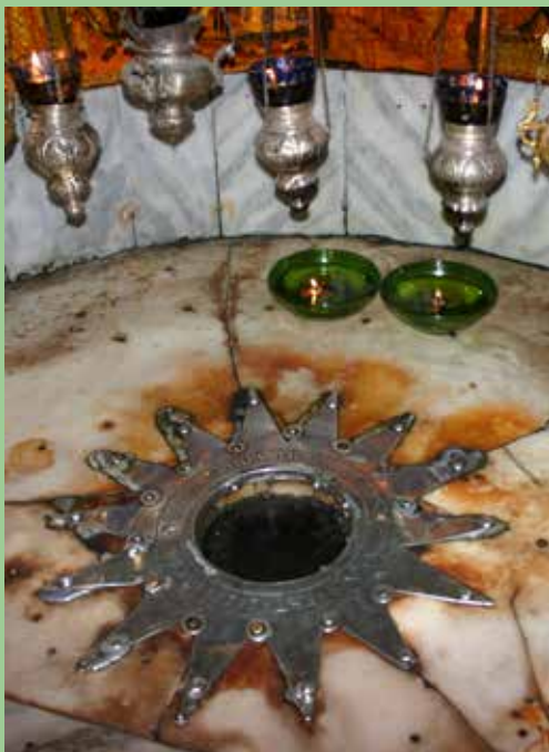
Der Stern von Bethlehem Vermutliche Geburtsstätte von Jesus

Achtung: schmale Stege müssen erhalten bleiben!!! Schneeflocke auffalten und glatt „bügeln“.