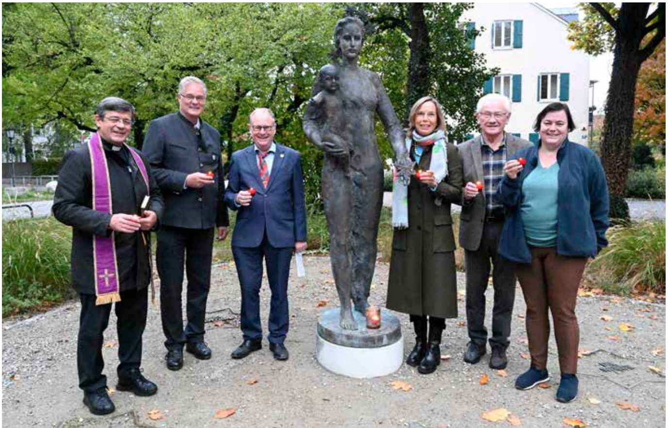
Nach dem Gebet für den Frieden bei der Patrona Bavariae (25. Oktober 2023)

damit endlich alle erkennen, was wirklich wichtig ist, dass wir dich „Vater“ nennen, der uns niemals vergisst!