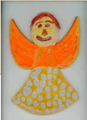
So ähnlich sehen alle zehn Engel aus. Und es ist ein Buchstabe drauf.

L ösungen werden gesammelt. Aus den Richtigen werden 10 Gewinner gezogen (Büchergutscheine).