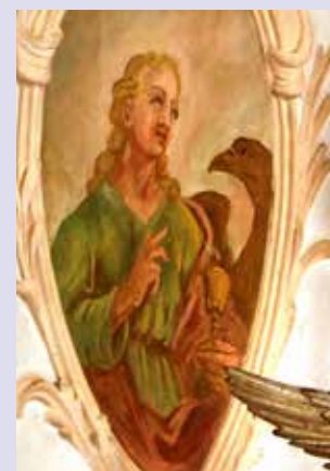
Hl. Johannes in St. Katharina

Johannes gelangt durch sein apostolisches Wirken nach Kleinasien. Dort wurde er laut Legende von einem Priester des Artemistempels gezwungen, der Göttin zu opfern oder aus dem Giftbecher zu trinken. Der Hl. Johannes nahm den Giftbecher und segnete den Inhalt mit dem Kreuzzeichen,